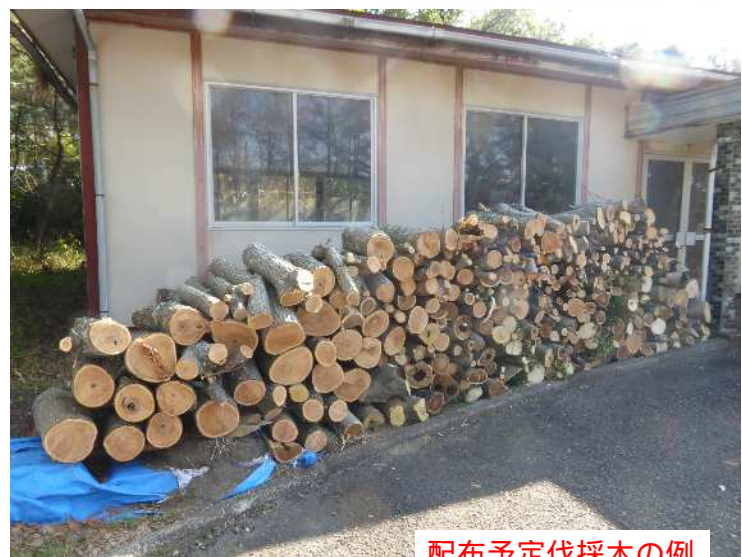
配布予定伐採木の例